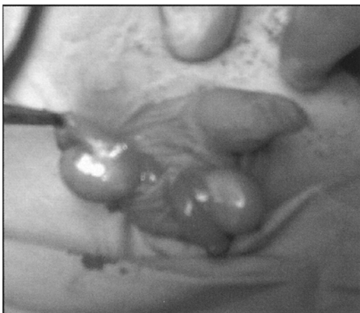
Figure 3 : Vue per opératoire de la descente des 2 testicules à travers le canal inguinal droit avec croisement du testicule gauche par voie trans-septale.

effectuée par son père 20 ans plus tôt [in 5]. Depuis, un peu plus cent cas ont été rapportés dans la littérature sous de multiples dénominations : ectopie testiculaire transverse, pseudo-duplication testiculaire, double testicule unilatéral, descente transversale aberrante du testicule, ou leurs équivalents en anglais : crossed testicular ectopia , et transverse testicular ectopia .