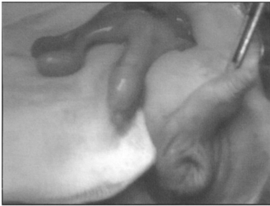
Figure 1 : Vue per opératoire de l'ectopie testiculaire croisée montrant les 2 testicules du même côté avec fusion des canaux déférents à leurs parties distales.